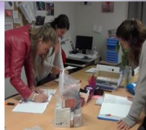
Une équipe passionnée