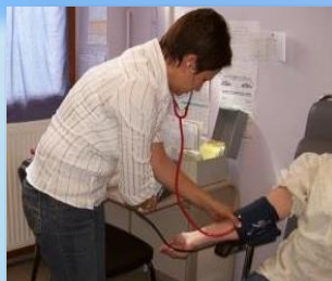
Soins au centre (122 rue de la République)