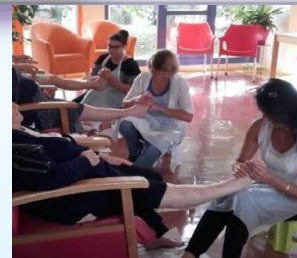
Des soins de bien être